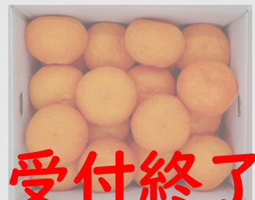
B160 伊予柑 3L~4Lサイズ