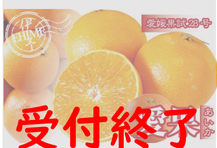
B172 訳あり 愛果28号 約2.5kg