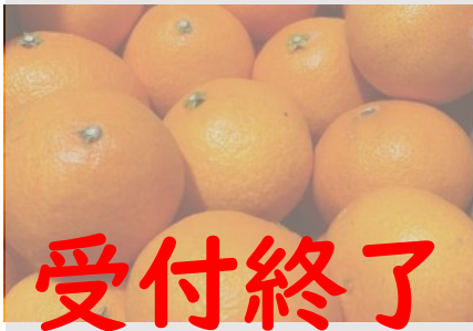
B40 愛果28号 (ハウス栽培)