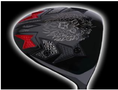
F02 エミリッドバハマCV8 REVEインパクトボロンリボルバー

アンケートでご要望をお伺いすることもできますので、希望の際はお申し付けください。