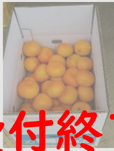
C37 ハウスみかん 5kg