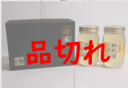
B38 藤田養蜂場 はちみつセット (びわ蜜×2本)