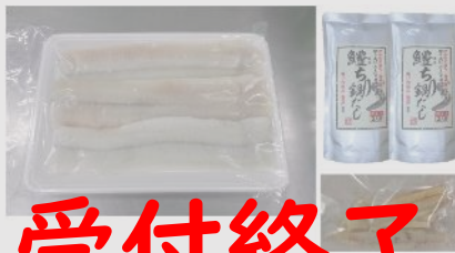
B101 愛媛県伊予市 活メ鰹短冊500gセット

鰹を活メにし、丁寧に骨切りしました。添加物等不使用。鰹本来の美味しさをご堪能ください。※発送7月1日～11月30日