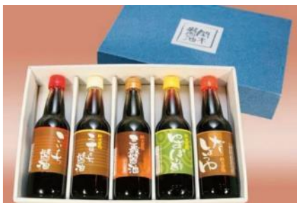
B17 関木醤油ギフトセット