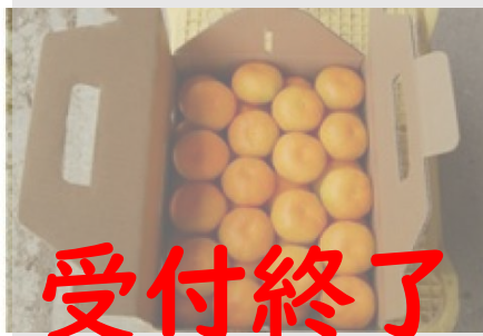
B129 ハウスみかん 2.5kg