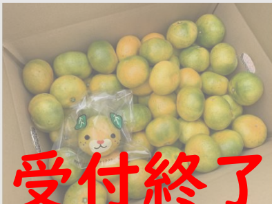
B178 極早生みかん 5kg