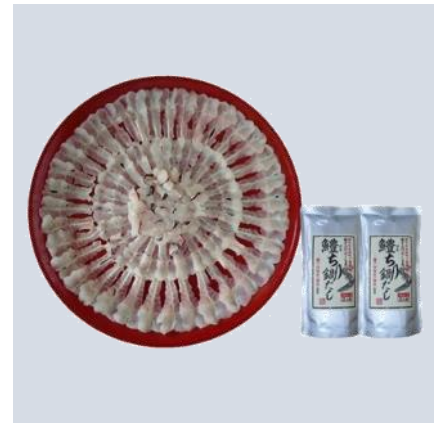
B102 愛媛県双海の朱鰹 鰹しゃぶセット

こだわりぬいた鮮度管理を行い、熟練の職人が丁寧に加工した見た目も美しい薄造りの鰹をしゃぶしゃぶでお愉しみください。