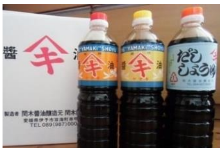
関木醤油3本セット

B16 だし醤油・濃口醤油・うす口醤油 B112 濃口醤油・うす口醤油・三歳醤油 それぞれ各1L