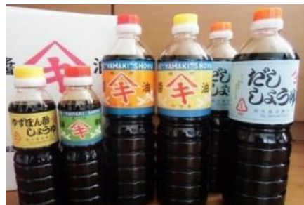
B18 関木醤油6本セット

だし醤油 1L×2本、 濃口醤油・うす口醤油 各1L 三歳醤油・ゆずぽん酢 各360ml