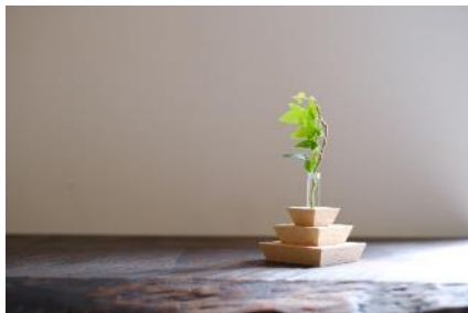
B54 ニッポンノシキ® ミドリ

愛媛県産「ひのき材」を使用した一輪挿しです。「うづくり」「無塗装」仕上げ。木目・香りをお楽しみいただけます。