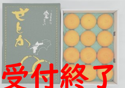
B42 【ご家庭用】愛媛県産せとか