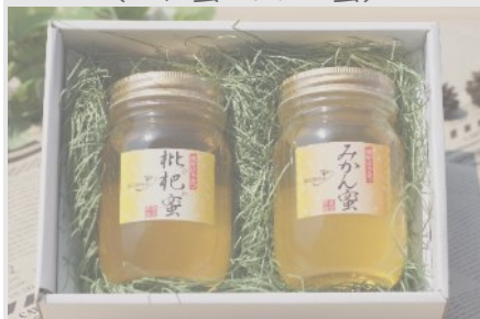
C15 藤田養蜂場 はちみつセット (びわ蜜・みかん蜜)