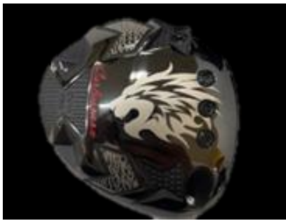
F05 エミリッドバハマCV11 デイトナスピーダー