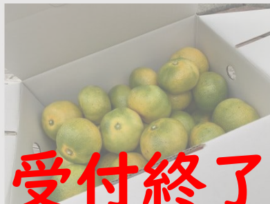
A15 極早生みかん 3kg