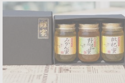
B37 藤田養蜂場 はちみつ食べ比べ セット(びわ蜜・みかん蜜・野の花)