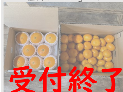
B163 愛果28号2kgと 温州みかん5kgセット