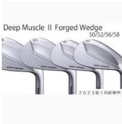
F07 ムジーク ディープマッスル ウエッジ 2本セット