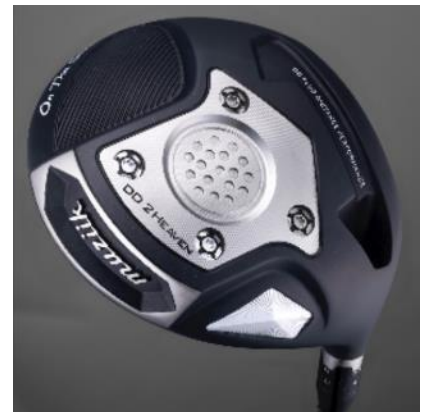
F08 ムジーク ゴルフクラブ フルセット (DW、FW2本、UT 2本、アイアン6本、ウエッジ2 本、パター)