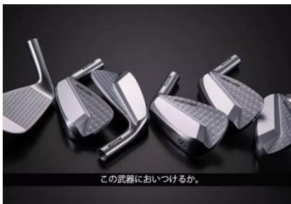
F17 ムジーク ディープマッスル2 アイアン 7本セット モーダスツアー