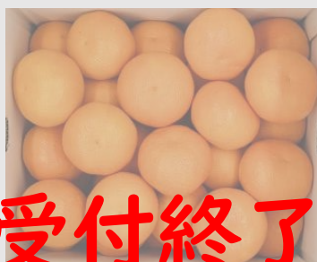
B161 伊予柑 L~2Lサイズ