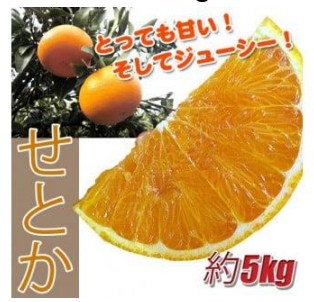
B146 せとか 5kg ご家庭用

せとかは平成生まれの人気品種です。「柑橘の大トロ」と言われるくらい濃厚で、果肉は非常にジューシーで甘く、濃厚な味が楽しめます。