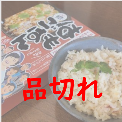
B06 双海・下灘のはもごはん 3パックセット

丁寧にとったはもの出汁とはもの身が入っています。生姜がふわっと香り、ハモの上品な味わいがクセになります。添加物不使用。