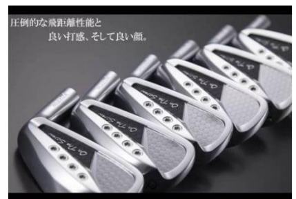
F16 ムジーク オンザスクリュー DDアイアン 6本セット モーダスツアー