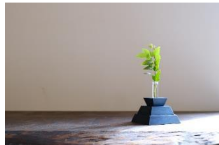
B53 ニッポンノシキ® アオ

愛媛県産ひのき材を、広島県福山市のデニム生地メーカー、カイハラ株式会社の染料の藍(インディゴ)で染めました。