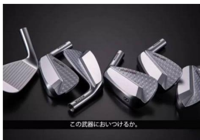
F15 ムジーク ディープマッスル2 アイアン 7本セット ダイヤモンドスピーダー