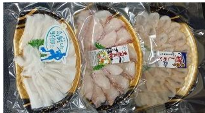
B103 愛媛伊予市下灘産 うお!づくし三種

下灘漁協で水揚げされた新鮮な真鯛、鰹、コウイカの薄造りセット。しゃぶしゃぶがおすすめです。