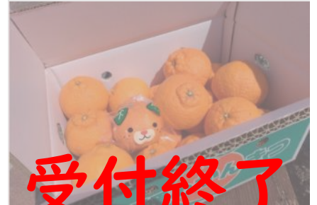
B119 不知火 (しらぬい) 5kg