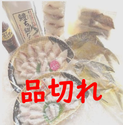
C33 双海・下灘の逸品詰め合わせ

鰹薄造り 100g (鰹しゃぶ用)、鯛切り身200g (鯛しゃぶ用)、松山風鯛めしキット(鯛めし2合炊き用)、宇和島風鯛めし(真鯛スライス10枚+たれ40g)、マナガツオ2尾、鰹ちりだしスープ 400g (2人前用)、ポン酢醤油 360ml