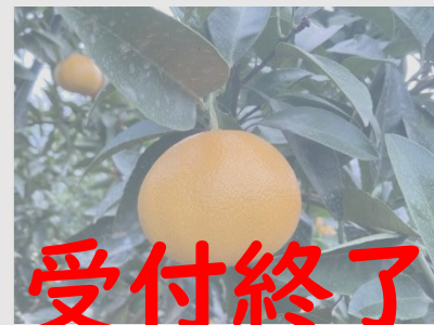
B169 愛果48号 2kg