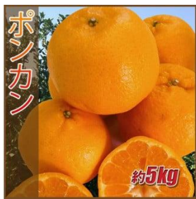
B147 ポンカン 5kg ご家庭用

ポンカンは、温州みかんより甘さが強く濃厚な感じがします。外皮はむきやすく、果肉を包む内皮は柔らかいので袋のまま食べられます。