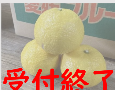
B162 農園直送はるか 5kg