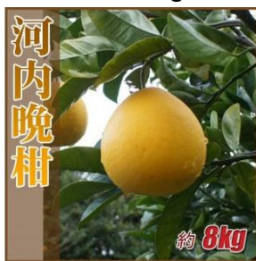
B150 河内晩柑 8kg ご家庭用

河内晩柑は初夏から夏にかけて収穫できる黄色くて大きな柑橘です。グレープフルーツに似ていますが、苦みは少なく、さっぱりとした甘さ。