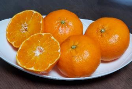
B104 甘平 (5kg) サイズM～5L

甘平は愛媛県オリジナルの品種で、 甘くシャキシャキした食感が特長です。 サイズは揃えて箱詰めいたします。