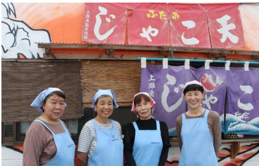
B09 双海じゃこ天・ラブじゃこ天セット