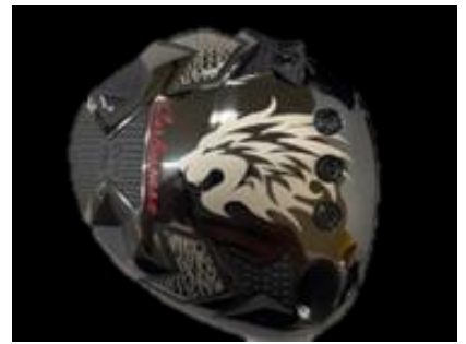
F06 エミリッドバハマCV11 インパクトボロンリボルバー