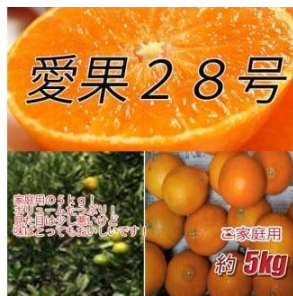
B148 愛果28号 5kg ご家庭用

愛媛県が育成した品種で、ゼリーのよ様な食感と甘い果汁、独特の香りが特徴です。施設栽培や袋かけをして大切に栽培されています。