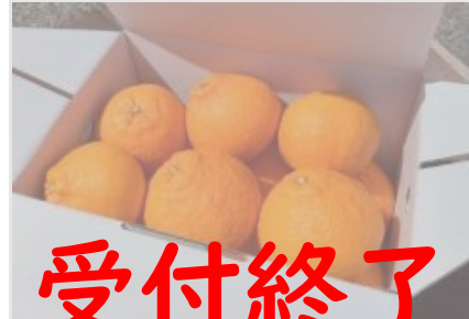
B118 不知火 (しらぬい) 3kg