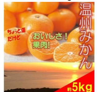
B149 温州みかん 5kg ご家庭用

温州みかんは、私たちが一般的に「みかん」と呼んでいる日本の代表的な柑橘類です。皮が薄くてむきやすく、食べやすいことおなじみのみかんです。