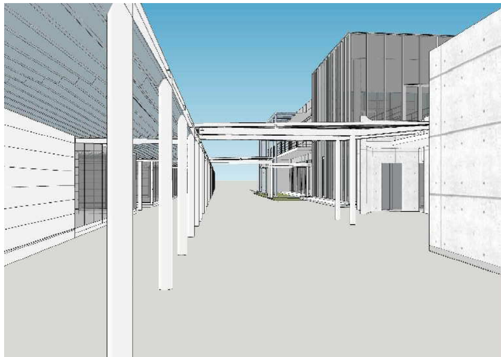
通路(道の駅トイレ棟よりから西を望む)