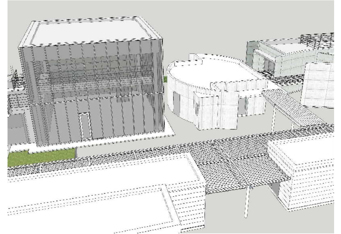
イベントホール棟・道の駅トイレ棟・更衣管理棟