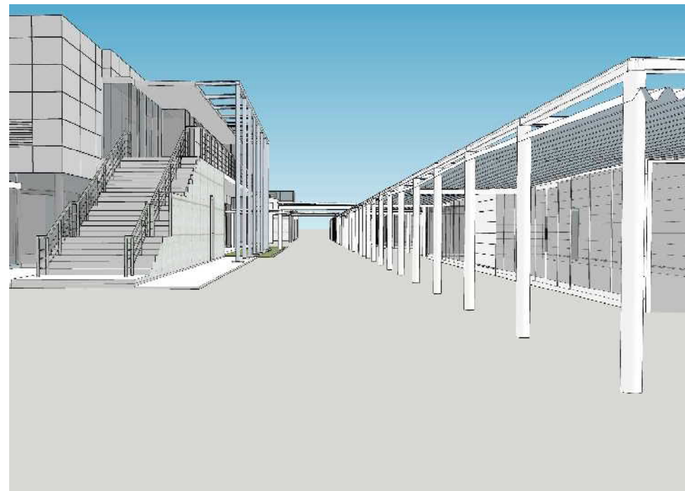
通路(風の交流広場側より東を望む)