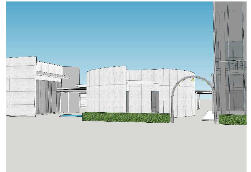
道の駅トイレ棟を海側より望む