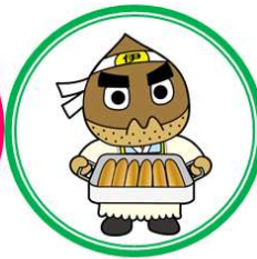
施設見学のご案内