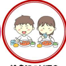
給食についての アンケート結果