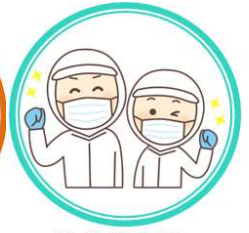
給食献立表・ 給食センターだより