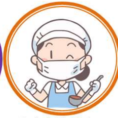
おすすめメニュー レシピ集