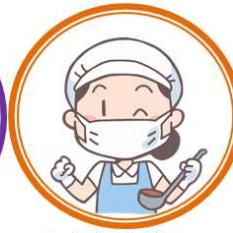
おすすめメニュー レシピ集