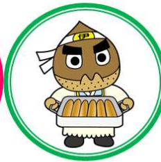
施設見学のご案内