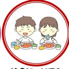
給食についての アンケート結果