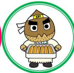
施設見学のご案内