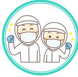
給食献立表・ 給食センターだより