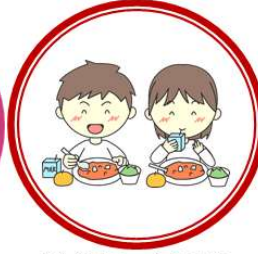
給食についての アンケート結果