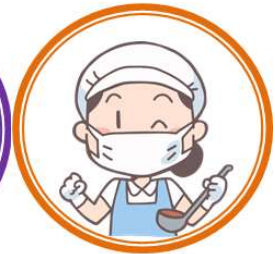
おすすめメニュー レシピ集