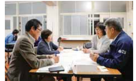
▲課題解決に向けた議論を行う

保護者、地域の方、校長や教職員などが委員となり、地域と学校が連携し、対等な立場で学校運営について話し合う場です。