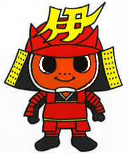
「ミカンまる」 伊豫國「あじの郷」づくり イメージキャラクター

愛媛県伊予市では、伊予市を愛し、応援したいという人たちの思いを個性豊かで魅力的なまちづくりに役立てるため、「ふるさと納税制度」を推進しています。10,000円以上のご寄附をいただいた方には、返礼品として伊予市の特産品を贈呈いたします。