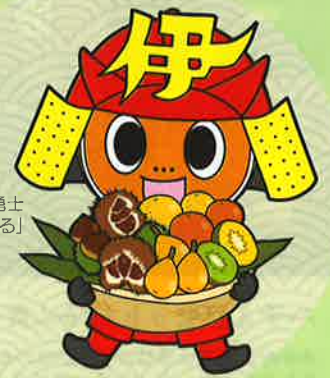
あじの五勇士 「ミカンまる」

※天候や注文状況により、返礼品のお届けが遅れる場合があります。 ※数量限定返礼品について、お届けできない場合がありますのでご了承ください。