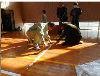
▲ラインテープも貼り換えました！