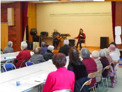
◀二胡とギター演奏会