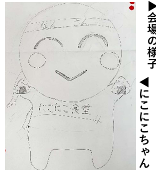
▲会場の様子 ▲にこここちゃん

2月25日（日）に緑風館にて、今年度2度目のこここ食堂を開催しました。当日は多くの人で賑わっており、皆さんカレーを食べながら様々な催し物を楽しまれました。今回はこここ食堂のキャラクターを地域の方に考えてもらい投票を行いました。見事、1番投票数の多かった「にこここちゃん」が選ばれました。おめでとうございます！どの作品も素晴らしく、御協力いただいた皆様、本当にありがとうございました。また、余剰品の提供、スタッフの皆様にもご協力いただき感謝申し上げます。