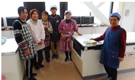
▲更生保護女性会の皆さん

3月3日（日）に大平地区公民館にて、更生保護女性会の皆さんが草餅作りを行いました。皆さんが作る草餅はとておいしく、同じ日に卒業イベントで集まっていた小学生たちにも分けてくださり美味しそうに食べていました。