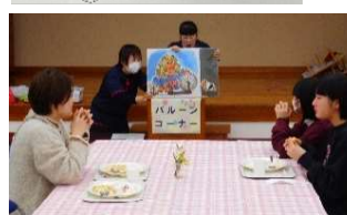
▲読み聞かせコーナー