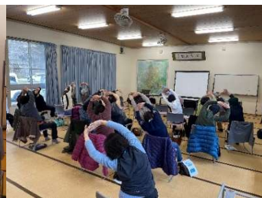
▲みかん丸体操をしました