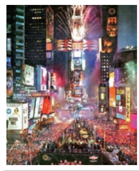
▶ニューヨークでの「New Year's Celebration」 (新年のお祝い)

* http://www.proactivechange.com/motivation/resolutions/research.htm (英語)