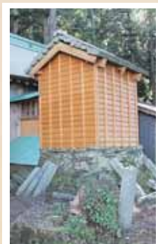
牛の峰地蔵尊石畳き屋根(市指定文化財)