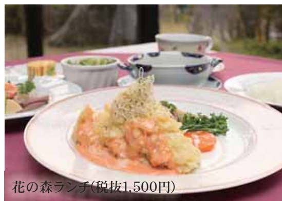
花の森ランチ(税抜1,500円)