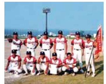
▲平成9年度伊予郡社会体育大会優勝時の様子

ようと、賛同する仲間と一緒に、町内の各地域へチーム設立を呼び掛けるため奔走しました。その働きもあり各地域から合計27チームが設立され、地域リーグが始まりました。