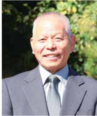
瑞宝双光章 (消防功労)