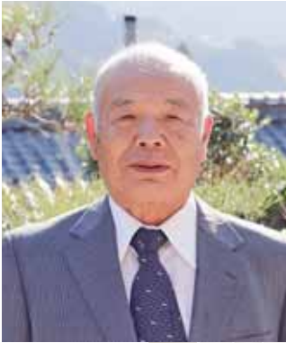
旭日単光章 (選挙管理事務功労)