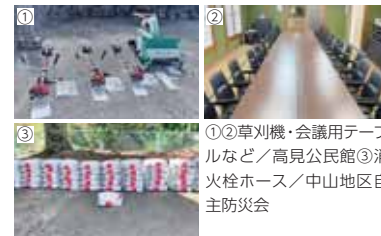
①②草刈機・会議用テーブルなど/高見公民館③消火栓ホース/中山地区自主防災会

宝くじ助成事業は、(一財)自治総合センターが地域コミュニティの活性化を目的として実施しています。 このたび、高見公民館にコミュニティ活動用具と中山地区自主防災会に消防設備を整備しました。