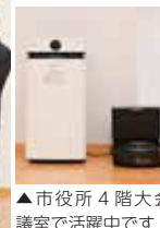
▲市役所 4 階大会議室で活躍中です