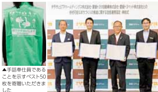
▲手話奉仕員であることを示すベスト50枚を寄贈いただきました

同協定は、それぞれが持つ資源や知識を活用することで、第2次伊予市総合計画に掲げている「まち・ひと とともに育ち輝く伊予市」の実現を目指すものです。