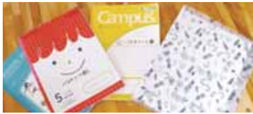
▲子どもたち一人一人と思いを共有するためのバスケノート