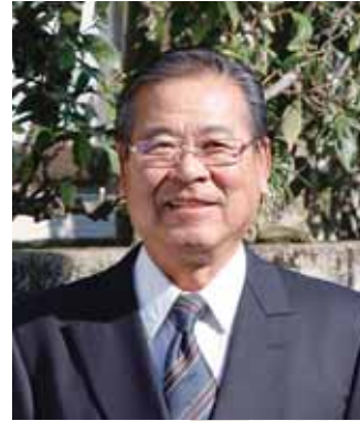
瑞宝双光章 (警察功労)