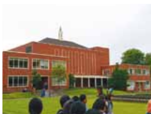
ウィラメット大学法科大学院

セーラムの小学校と中等学校はセーラム＝カイザー公立学区の一部を構成しています。セーラム＝カイザー公立学区では 41,000 人の児童・生徒が学んでおり、州内第 2 位の人口規模を持つ公立学区となっています。市内には他にも、ブランケット・カトリック・スクールやセーラム・アカデミー・クリスチャンなど私立の小学校や中等学校が数多く存在しています。