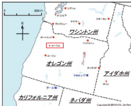
セーラム市の位置

セーラムは 1842 年に設立し、1851 年にオレゴン準州の準州都となった後、1857 年に市として法人化されました。