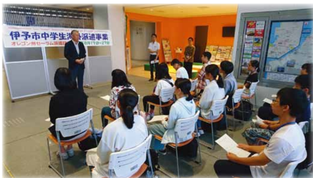
《 出発式（伊予市役所） 》