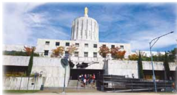
《オレゴン州議会議場視察》