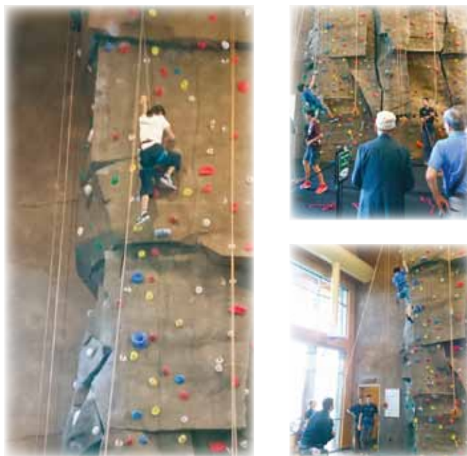
《クロックセンターでの体験学習》