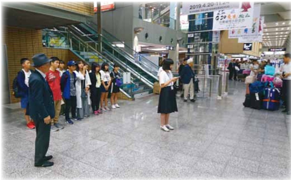
《 解団式（松山空港） 》