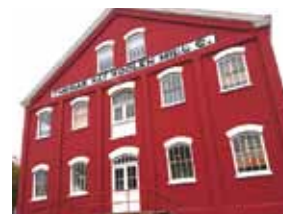
ミッション・ミル博物館

セーラムのダウンタウンには、観光名所が多く存在します。オレゴン州会議事堂やそれに隣接するウィルソン公園のほか、ミッション・ミル博物館、ハリー・フォード美術館、エルノシア劇場、リバーフロント公園、ウィラメット川、さらにオレゴン州有数の歴史的建造物が数多くあります。