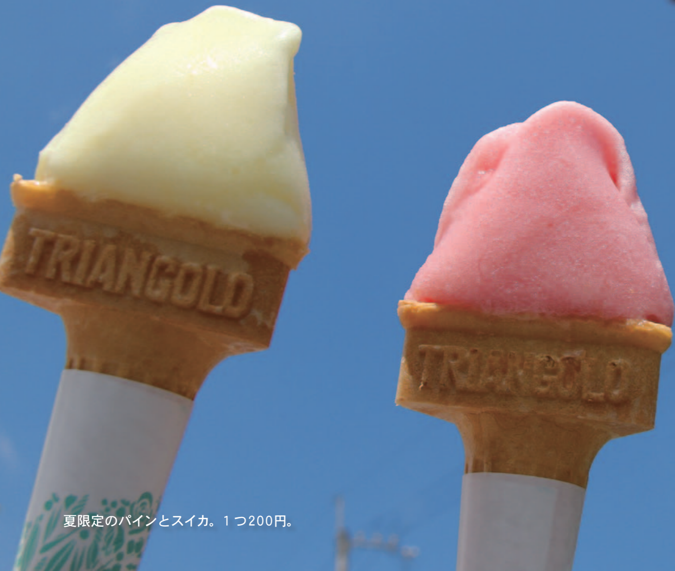
夏限定のピンとスイカ。1つ200円。