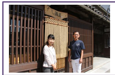
移住相談窓口「いよりん」

移住相談窓口設置による移住・定住の促進 集会所改修等事業による地域活性化 参画協働推進委員会設置による協働のまちづくり推進 市民討議会や SDGs 事業による総合計画の推進 公会計制度導入による財政状況の分析・活用