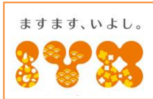
「ますます、いよし。」ブランドロゴ

農業活性化緊急対策事業による農作物生産技術などの向上 森林・山村多面的機能発揮対策事業などの森林機能保全 県営林道開設事業に対する負担金 クラフトの里などの観光施設運営 地域ブランド力強化事業による「ますます、いよし。」ブランドの周知