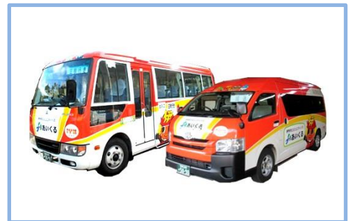
コミュニティバス

都市再生整備計画事業などの効率的なまちづくりの推進 地域公共交通事業などの地域住民の移動手段の確保 橋梁定期点検事業による橋の安全性確保 自主防災組織育成事業などの災害対策 家庭用燃料電池設置事業などの新エネルギー普及支援