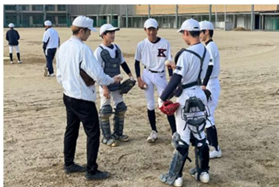
外部人材を活用した実証事業