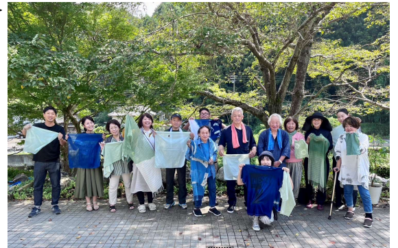
双藍が実施した藍染め体験会の様子