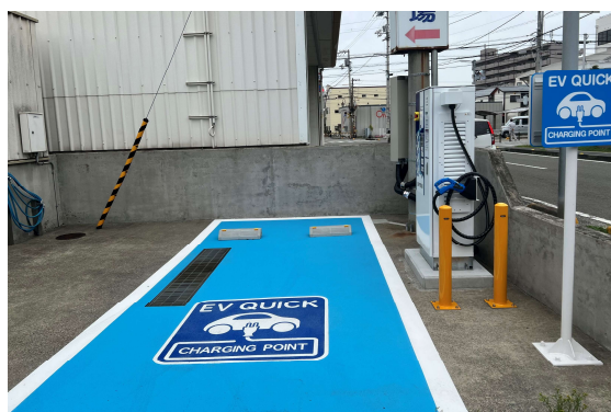
市役所駐車場に設置した急速充電器