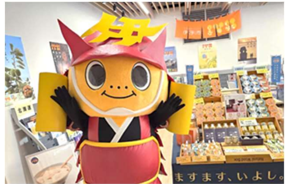
東京都港区で開催した物産展