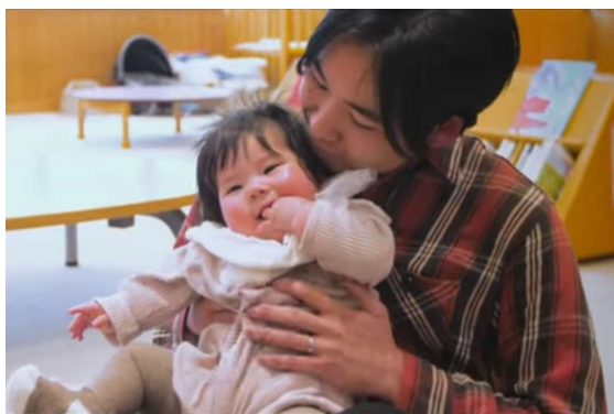
パパの積極的な子育てを応援します！