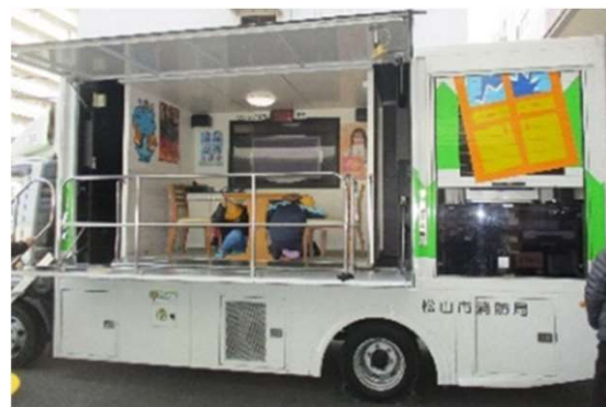
地震体験車を使った防災学習