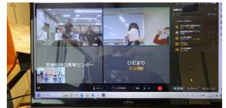
「わあー ときどきする」

2月22日（木）総合教育センターの教室と愛媛県内の教育支援教室との交流会を生徒がリモートで行いました。自己紹介が始まると、子どもたちは緊張した様子で他教室の生徒が映っているテレビ画面を見ていましたが、自分の番が来るときちんと自己紹介ができ、他教室からも歓迎の拍手を受けました。親睦タイムでは、教室毎にサイコロゲームで得点を競ったり「どちらが好きですか」というマジョリティゲームを行い、教室生との親睦を深めたりするなど、子どもたちの心が徐々に打ちとけていきました。