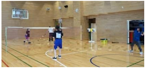
☆週二回のスポーツタイム↓