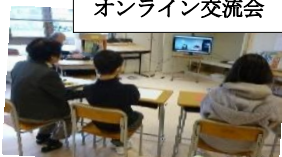
オンライン交流会