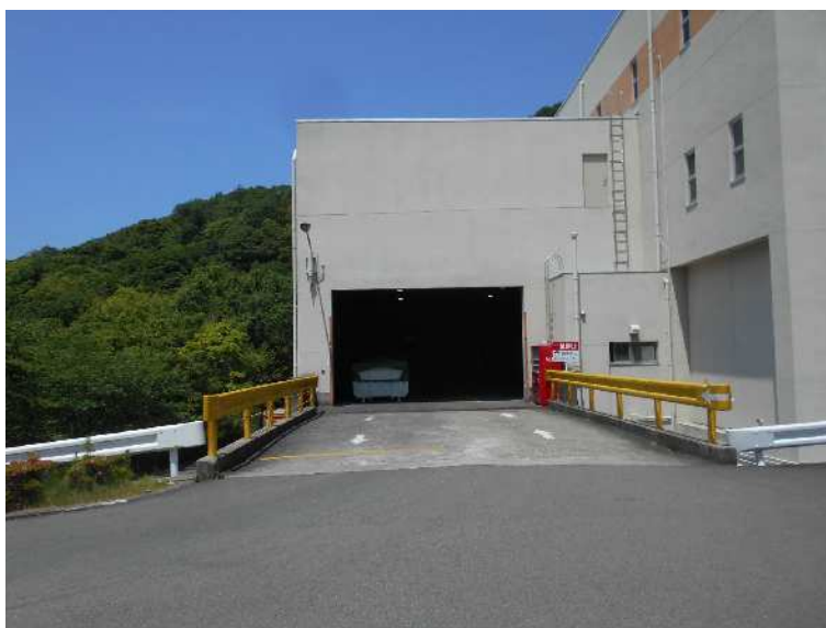
建物東面 プラットホーム