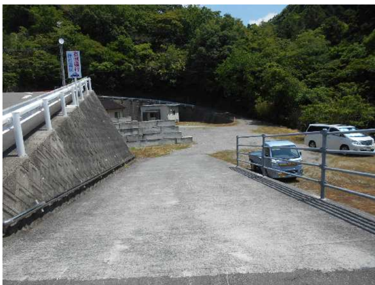
空きスペース南側スロープ