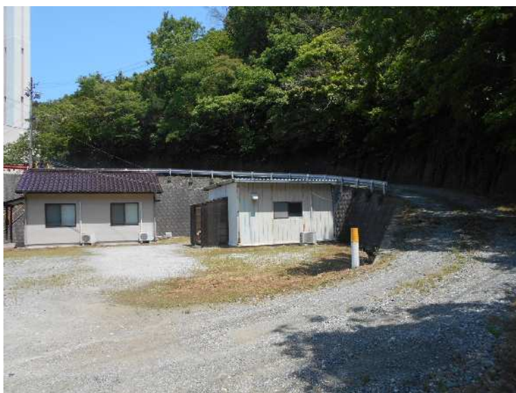
空きスペース北側