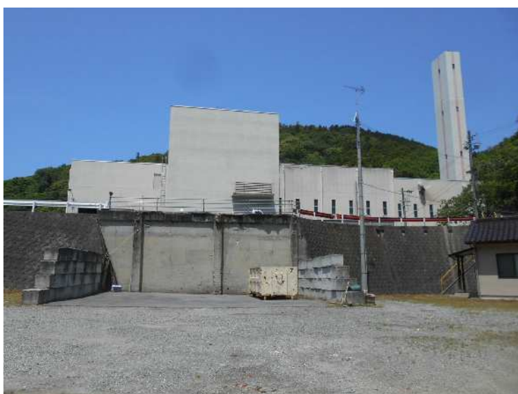
空きスペース西側