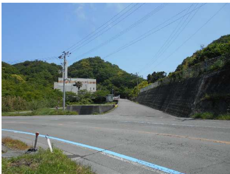
敷地南側国道378号より