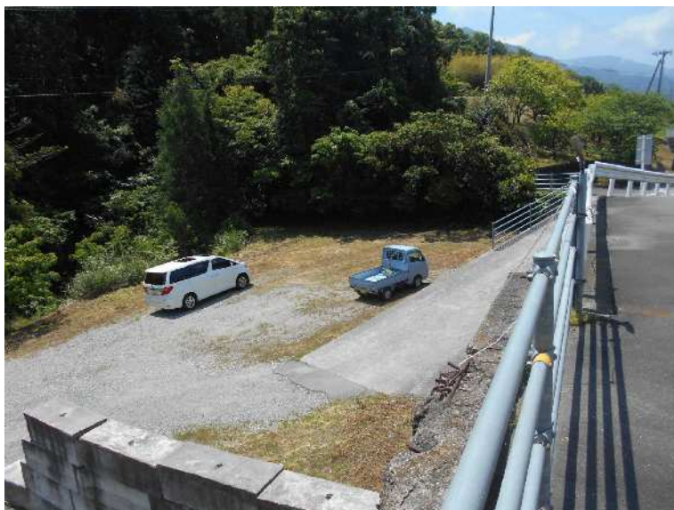
空きスペース南側