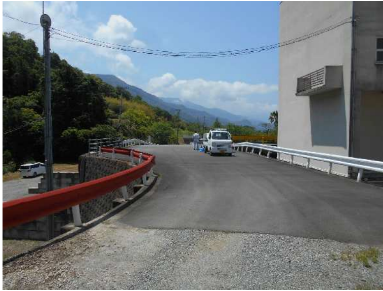
建物東側敷地内道路