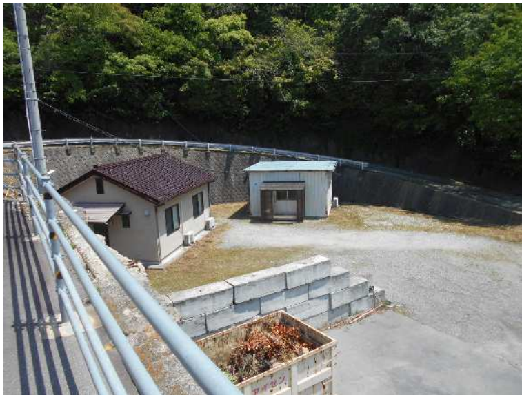
空きスペース北側