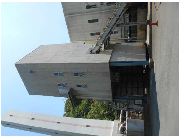
建物西面 灰固化処理棟