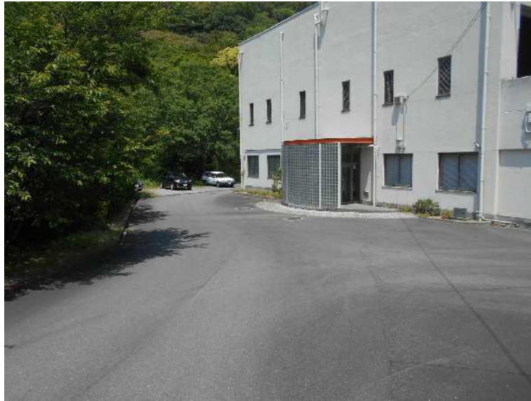
建物南面 玄関付近