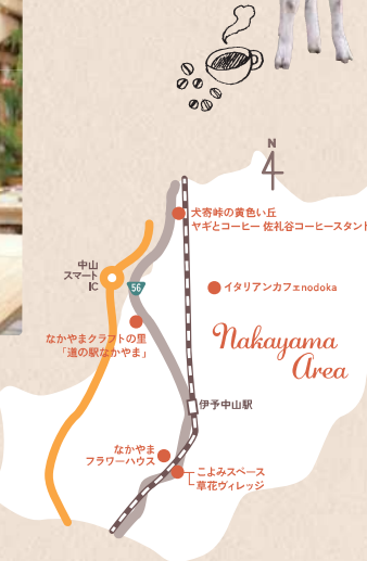
撮影場所: ヤギとコーヒー 佐礼谷コーヒースタンド ▶