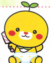
愛媛県こみきやん