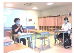
(阿部先生から学ぶ)

はばたき教室での貴重な手話教室です。今ここで学んでいる手話を身に付けることで、子どもたちが手話に興味を持つきっかけとなり、優しい心を持ち続ける大人になってほしいと願っています。