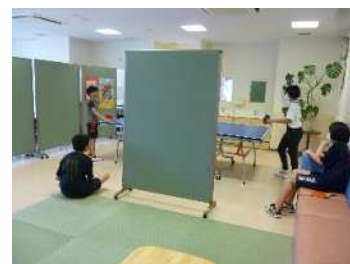
(和気あいあいと卓球)

また、9月から新たに教室生が加わり、毎日の活動にも活気を感じています。子どもたちは、バレーボールができるのを楽しみにしています。子どもたちの思いを大切にしながら、バレーボールやバドミントンで思い切り体を動かし、心身を元気にしていきたいと思っています。