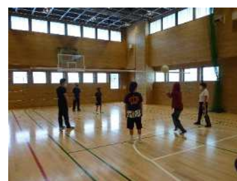
（懸命にボールを追っています）

子どもたちは、体験活動の中でも特にスポーツタイムを重ねるたびに、確実に自信をつけてきています。今後の上達が楽しみです。