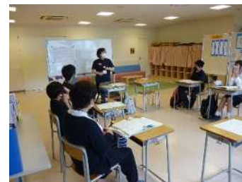
（上手にあいさつできたかな？）

手話教室を通して、児童生徒、指導員共に、「継続することの大切さ」を感じています。