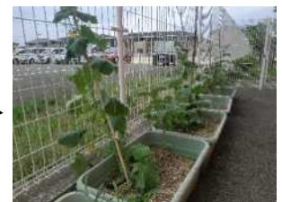
(実をつけ、喜ぶ子どもたち)

6月に栽培用のプランターに一人ずつ植えた野菜が実をつけ始めました。子どもたちは「キュウリができた。」と、水やりにも力が入ります。自分の野菜となると大切に世話をし、水やりや草抜きをします。野菜の成長を楽しみにしながら、自分が育てた野菜を収穫して食べ、育てる楽しさを感じています。