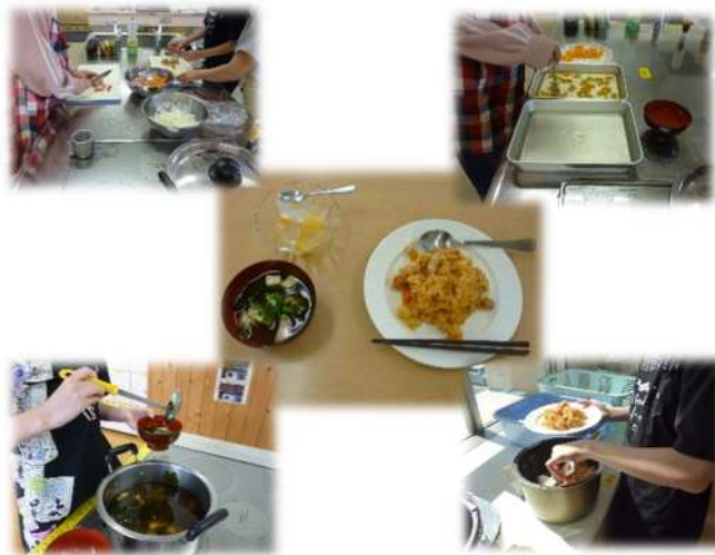
（炊飯器でこんなに上手くできた！）

初めて調理実習に参加する教室生がいましたが、友達と協力し合って手際よく調理を進めることができました。自分たちで作ったチキンライス、すまし汁、ゼリーをみんなで美味しくいただきました。また、前回同様、食器洗いも適宜行うことができ、予定時間内で全て終了しました。子どもたちの自信につながっていると感じました。