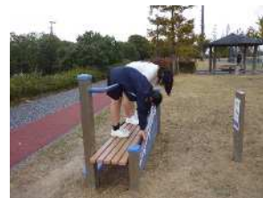
（どこまで曲がるかな！）

また、友達と話しながら歩く楽しさや、草花や木々が紅葉するなどの季節の変化を五感で味わっているようです。