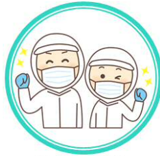
給食献立表・ 給食センターだより