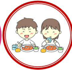
給食についての アンケート結果