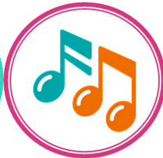
給食センター イメージソング