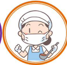
おすすめメニュー レシピ集