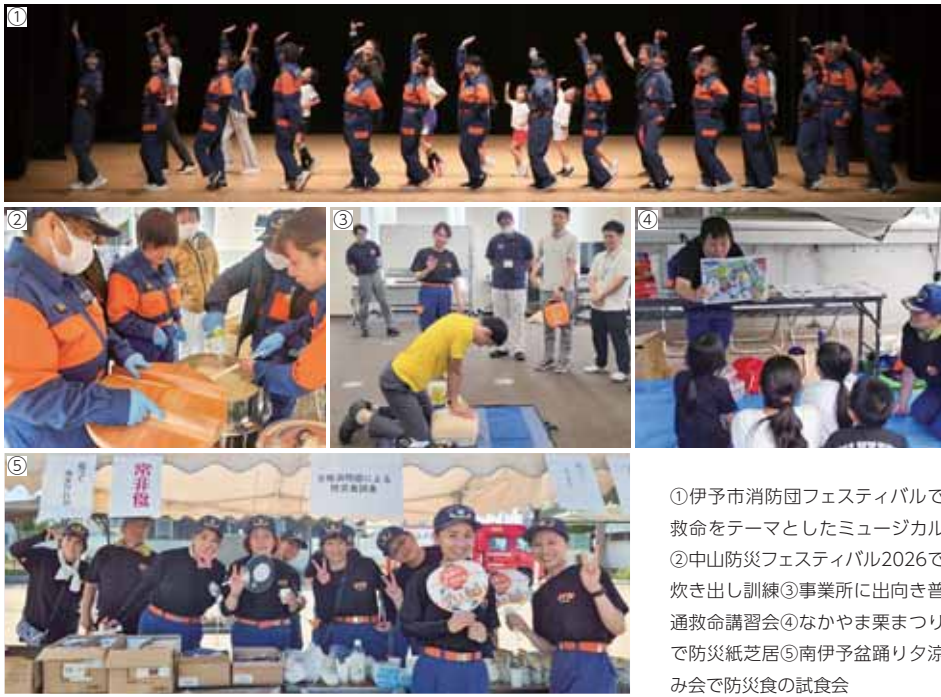
①伊予市消防団フェスティバルで救命をテーマとしたミュージカル ②中山防災フェスティバル2026で炊き出し訓練③事業所に向き普通救命講習会④なかやま栗まつりで防災紙芝居⑤南伊予盆踊り夕涼み会で防災食の試食会

防災知識の普及啓発を目的に、普通救命講習やイベントでの広報活動など、さまざまな取り組みを行っています。令和7年度に実施した主な活動をご紹介します。