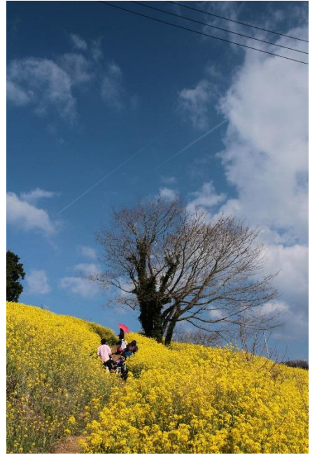
みんなが楽しく集まれる場所を目指し、昔みかん畑だった耕作放棄地を再開拓したされだにのシンボルである”黄色い丘”の春の風景