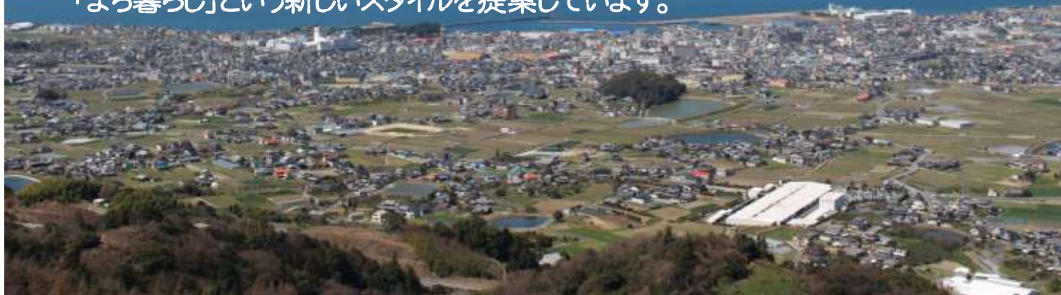
▲ 写真は谷上山展望台から郡中まちなかを一望

いきなり田舎暮らしに飛びこむのは不安。 そんな人に向けて、伊予市郡中では、都会と田舎の中間点にある 「まち暮らし」という新しいスタイルを提案しています。