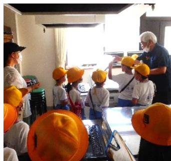
↑館長から各部屋の役割を教わっています

難しい話もあったようですが、地域のことを知るきっかけになったのではないのでしょうか。