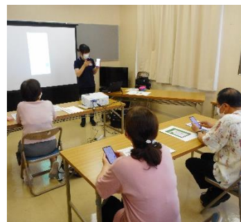
↑体験用スマホを使いながら様々な使い方を学びました