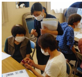
↑一人一人丁寧に教えてもらっていました

「はじめてのスマホ教室」と「スマホ個別相談会」は、10月にも開催予定です。ぜひご参加ください。