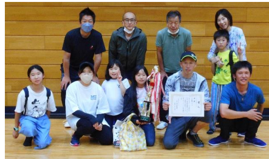
スマイルボウリング優勝(大地蔵チームの皆さん)