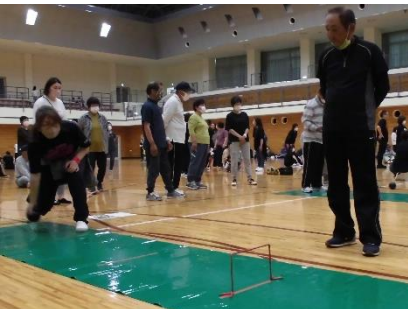
(スマイルボウリングの様子)