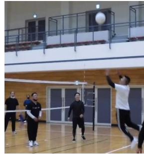
(男子レクバレーの様子)