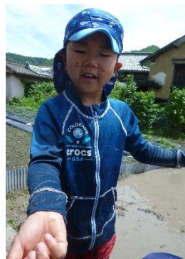
(アメンボgetした様子)

6月9日(金)に園児たちが田んぼで、どろんこ遊びをしました。ビーチフラッグや「おおかみさん今何時?」の集団遊びをして、「気持ちいい、楽しい」と大満足でした。