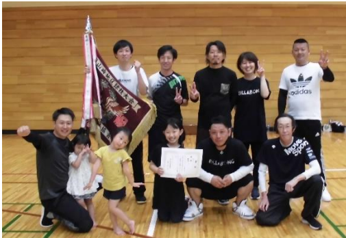
↑男子レクバレー優勝(梶畑チームの皆さん)

スマイルボウリングでは予選から白熱した試合展開で、大いに盛り上がり、若い方からお年寄りの方まで幅広い年代の方が楽しんでる様子がうかがえました。男子レクバレーでは、あいにくの天気のため、ソフトボールから競技変更になったにもかかわらず、こちらも大いに盛り上がっていました。