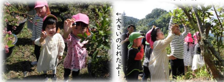
←大きいのとれたよ！