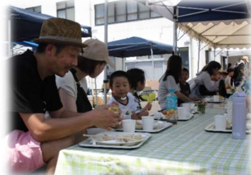
←皆さん談笑しながら、お美味しそうに食事をしていました。