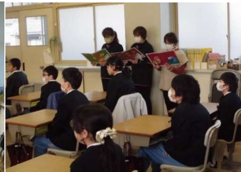
▲生徒たちは真剣に人権学習に取り組んでいました。