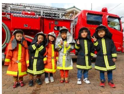
▲みんなカッコいいです！

当日は消防士の方に来ていただき避難や消化方法を教してもらい、消防車と消防服を着て写真を撮ったりしていました。消防車は迫力がありました！