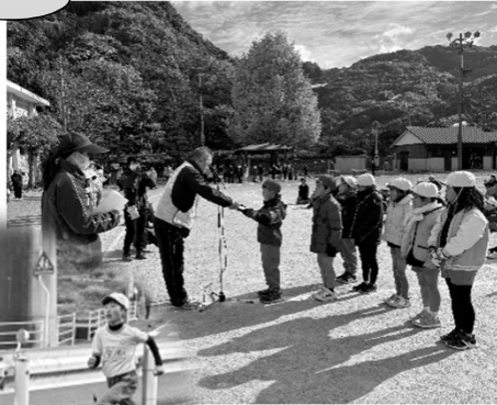
校内マラソン大会