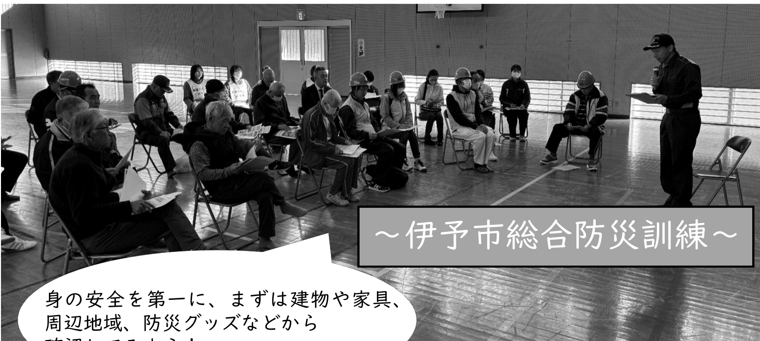
～伊予市総合防災訓練～

身の安全を第一に、まずは建物や家具、周辺地域、防災グッズなどから確認してみよう！