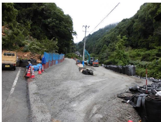
長崎谷集落へ続く市道 仮の迂回路は完成 (7月14日撮影)

7月7日から数日にわたる大雨により伊予市では度々大雨警報が発令され、河川の増水や土砂災害の危険が高い状態が続きました。