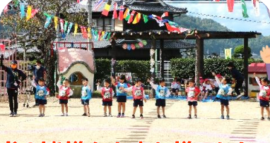
園児のみなさん、よくがんばりました！保護者の皆様もお疲れ様でした。