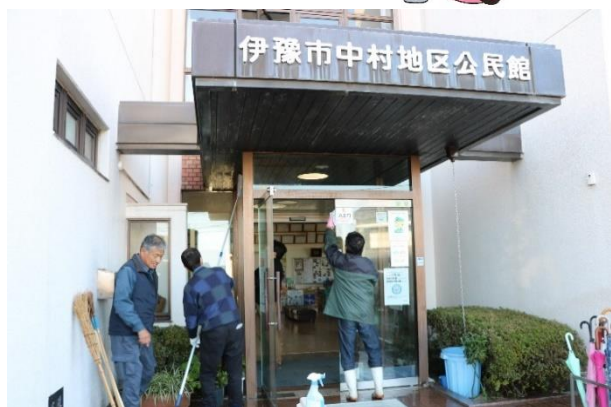
公民館清掃の様子