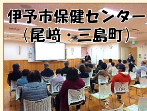
伊予市保健センター (尾崎・三島町)