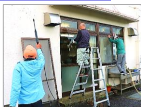
▲清掃作業中の様子

12月11日(日)に、公民館清掃を実施 しました。この日は天候が優れず、 少し寒い中での作業となりましたが、 多くの方にご参加いただき、屋内だ けでなく施設の外回りまでとてもき れいになりました。参加していただ いた皆さん、ありがとうございました。