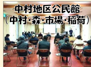
中村地区公民館 (中村・森・市場・稲荷)