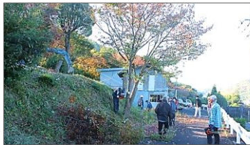
▲調査に先立ち、地元住民による支障木の伐採作業が11月に行われました。

令和5年2月中旬に、市場南組の中盛墓地にある「市場南組窯跡群」の第9次調査を実施します。昨年の第8次調査では、愛媛県内最古級の窯跡を発見しました。期間中、多くの専門家や史跡見学者の来訪が予想されます。近隣住民の皆様には、調査への御理解をお願い申し上げます。調査現場の一般開放については、2月号でお知らせします。