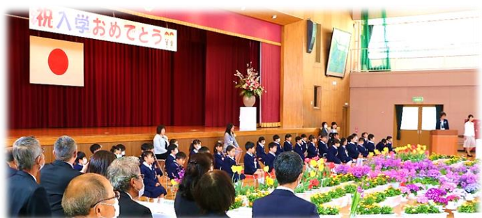
▲北山崎小学校では、41名の児童が新入生として仲間入りしました。

北山崎校区では、港南中学校、北山崎幼稚園、なかむら保育所でも入学式、入園式がありました。地域の皆様には、子どもたちの通学時の交通安全や、不審者などが危害を加えることが無いよう、地域全体での見守りをよろしく願います。