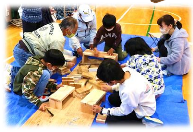
▲各地区からご参加いただいた皆さん ▲わなげ(特大)は、子どもに大人気でした。 ▲みんな真剣に取り組んでいました