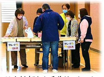
▲JA女性部さん手作りのおいしいマドレーヌは、すべて完売しました。

◀成績の良かったチームには、景品(お菓子)を贈呈しました。参加していただいた皆さん、ありがとうございました!