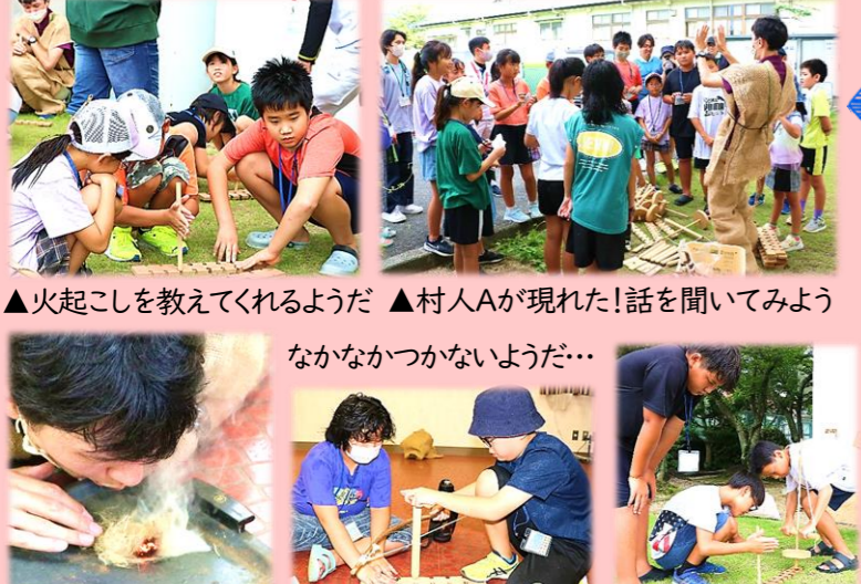
▲火起こしを教えてくださいようだ ▲村人Aが現れた!話を聞いてみよう なかなかつかないようだ… ▲子どもたちは火起こしに成功した!(数人だけ)村人Aは喜んだ!