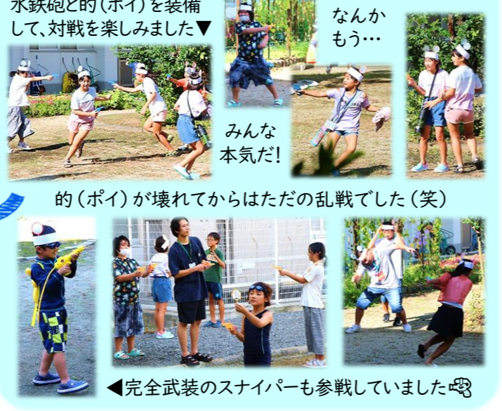
水鉄砲的(ポイ)を装備して、対戦を楽しみました▼ ▲みんな本気だ! ▲完全武装のスナイパーも参戦していました ▲楽しそうに遊んでいます