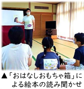
▲「おはなしおもちゃ箱」による絵本の読み聞かせ