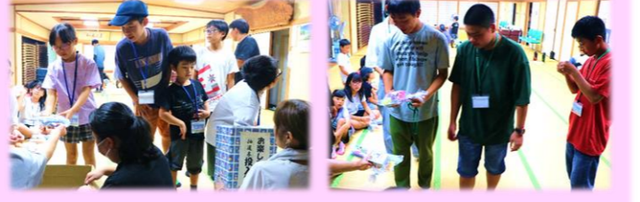
▲抽選中…何が当たるかな? ▲手伝ってくれた中学生にも♪