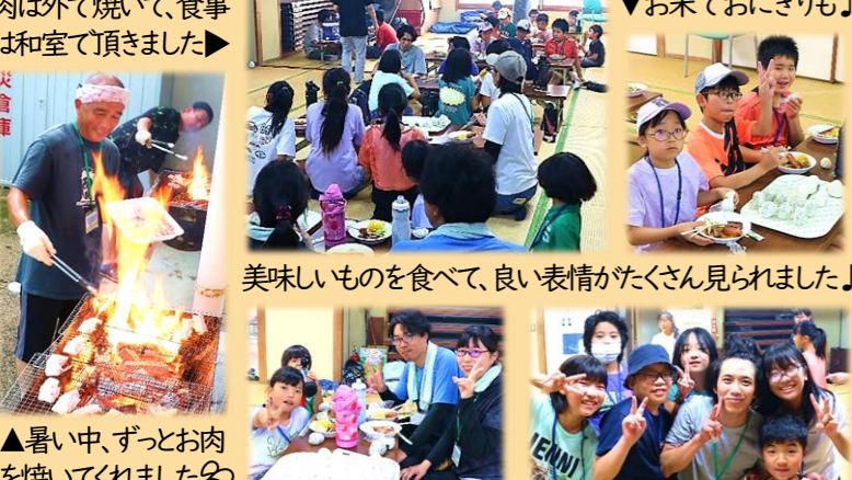
肉は外で焼いて、食事は和室で頂きました▶ ▲暑い中、ずっとお肉を焼いてくれました♪ ▲おいしいものを食べて、良い表情がたくさん見られました♪