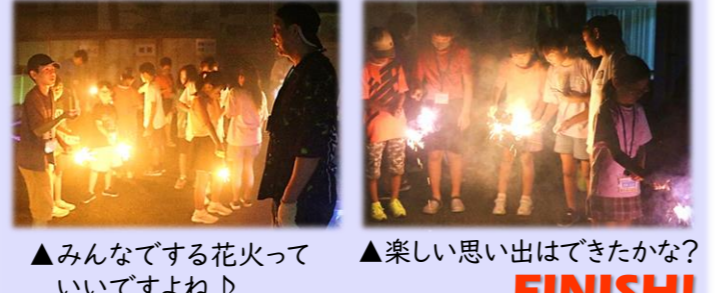
▲みんなでする花火っていいですね♪ ▲楽しい思い出はできたかな? FINISH!