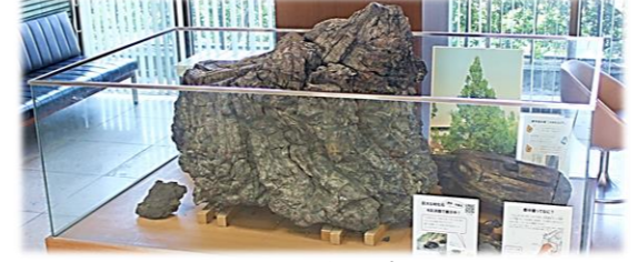
彩浜館のことは商工観光課(☎982-1120)、扶桑木のことは社会教育課(☎982-5155)まで

彩浜館で扶桑木を展示しています 昨年まで双海地域事務所展示していた扶桑木ですが、現在は彩浜館に移設して展示しています。扶桑木は、平成22年に大谷海岸(森地区)で採集された200万年～1000万年前の巨大な木の化石(珪化木)です。ご興味のある方はぜひ一度、実物をご覧になってみてください。