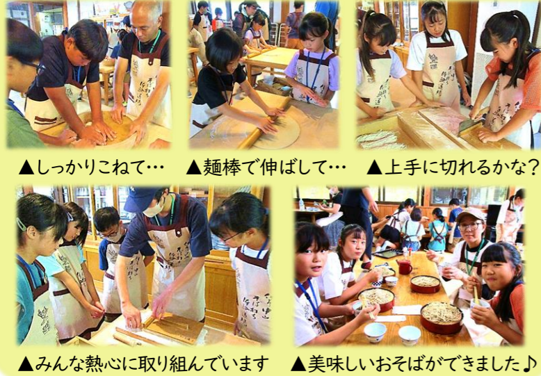
▲しっかりこねて… ▲麺棒で伸ばして… ▲上手に切れるかな? ▲みんな熱心に取り組んでいます ▲美味しいおそばができました♪