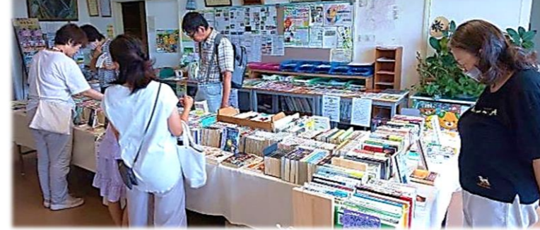
▲古本交換会は、眠っている本を必要な人に届けるとともに、まだ読んでない本と出会うことができる素敵なイベントです☆

9月17日(日)に、中村地区公民館で「本に親しむ一日」イベントが開催されました。この日は前回の古本交換会に加えて、「おはなしおもちゃ箱」さんによる絵本の読み聞かせや、「推し本紹介タイム」などもあり、来場された方は、持参した本を交換して、新たな本との出会いを楽しんでいました。