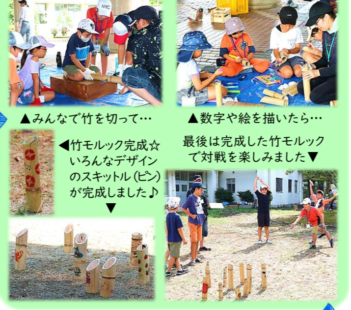
▲みんなで竹を切って… ▲数字や絵を描いたら… ▲竹モルック完成☆いろいろなデザインのスキットル(ピン)が完成しました♪ ▲数字や絵を描いたら… 最後は完成した竹モルックで対戦を楽しみました▼ ▲みんな熱心に取り組んでいます ▲美味しいおそばができました♪