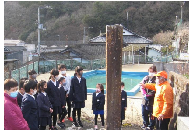
1/27 佐礼谷「 たかおよしゆきしょうとくひ 鷹尾吉循頌徳碑」を訪ねる

地域の方々の工夫を凝らした指導によって、子どもたちは一回り大きくなったようでした。