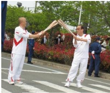
聖火をつなぐランナー

4月22日、しおさい公園周辺でTokyo2020オリンピックの聖火リレーが伊予市でも行われました。9人のランナーが聖火をつなぎ、希望の光となるよう願いました。