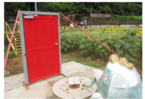
進化し続ける「なかやまサンテラス」