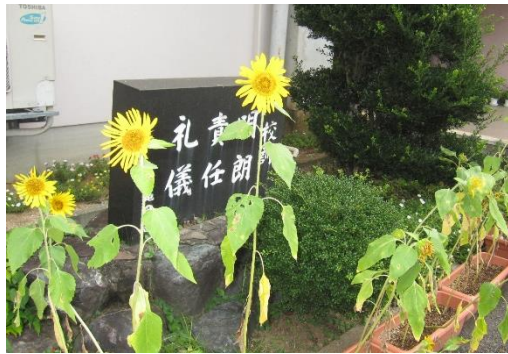
中山中で育てたひまわり