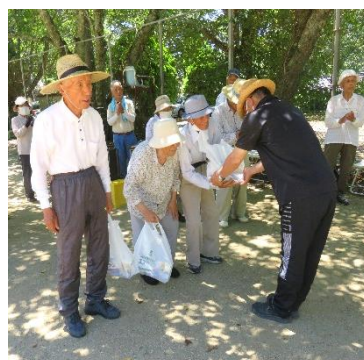
準優勝チーム表彰