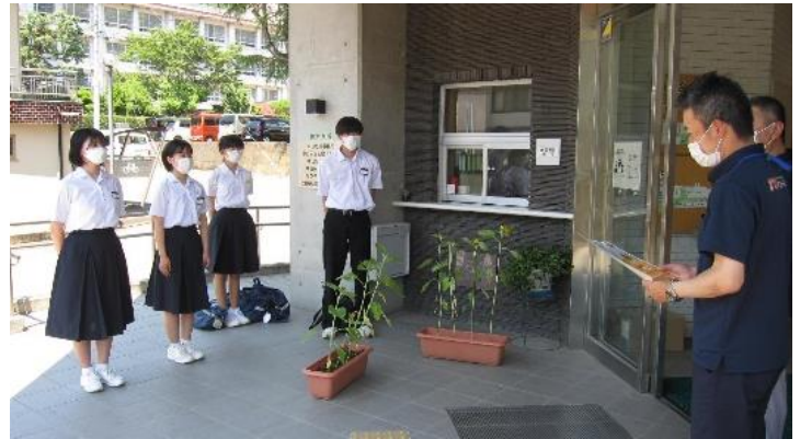
地域事務所にひまわりを贈る中学生