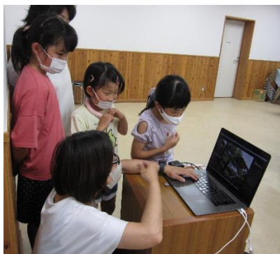
お気に入りの写真を選んでいきます