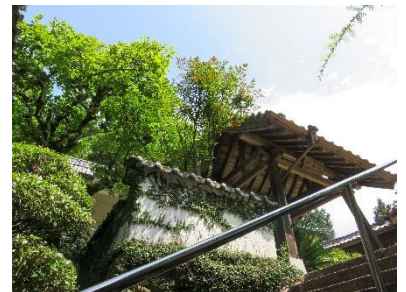
小学生が盛景寺で撮った作品から