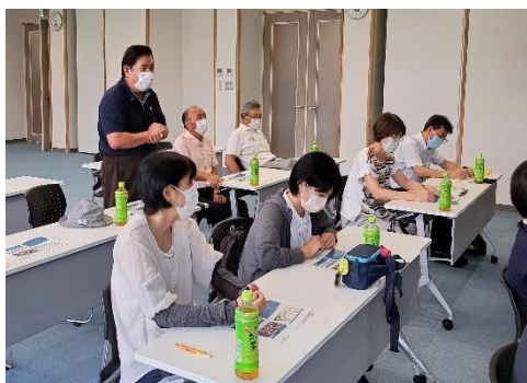
防災教育について愛南町と意見交換

学校・地域が協力して、防災の実践的な知識を習得し、自ら考え行動する児童を育てることなどを目指します。今後、児童による防災マップ作りや防災学習会などに取り組みます。