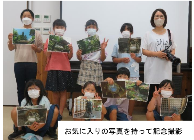
お気に入りの写真を持って記念撮影