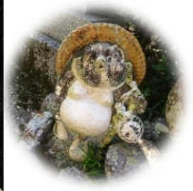
小学生の作品から