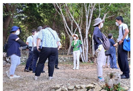
福浦地区の避難訓練の取り組みを聞く