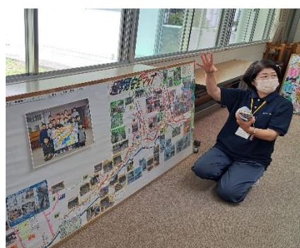
福浦小児童作成の防災マップの説明