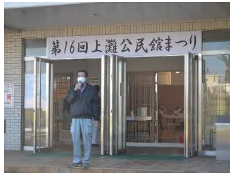
上灘公民館まつりスタート！