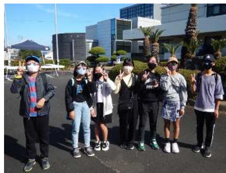
仲良しメンバーでのご来場