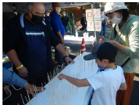
何が当たるかワクワク！