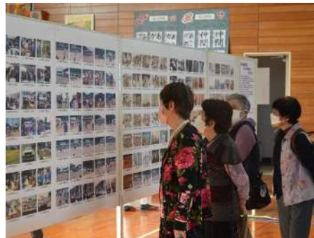
住民の皆さん提供の写真展