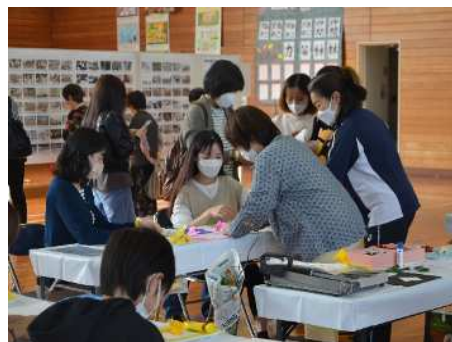
折り紙教室が大盛況！