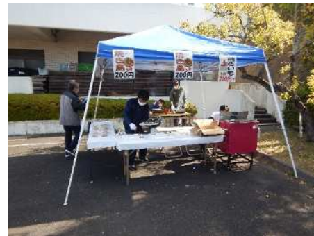
自治公民館の出店