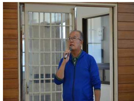
来年も地域一丸で！