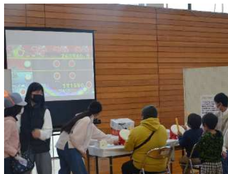
Zennigerが運営したeスポーツ