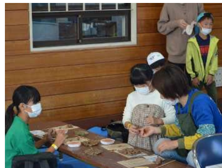
恒例の陶芸教室も好評！