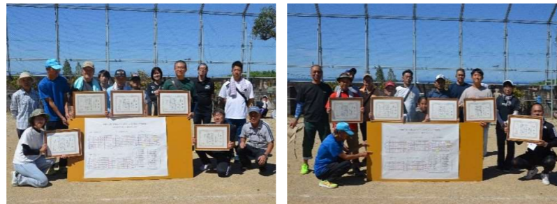
各ブロックの優勝チーム、準優勝チームの皆さんです 左：優勝チーム、右：準優勝チーム

モルックという少人数から参加できる種目になったことで、数年ぶりに地域の行事に参加することができました。久しぶりに地域の方と会って話をするのができてとても楽しかったです。