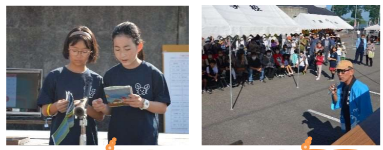
子ども読み語り隊 お楽しみ抽選会