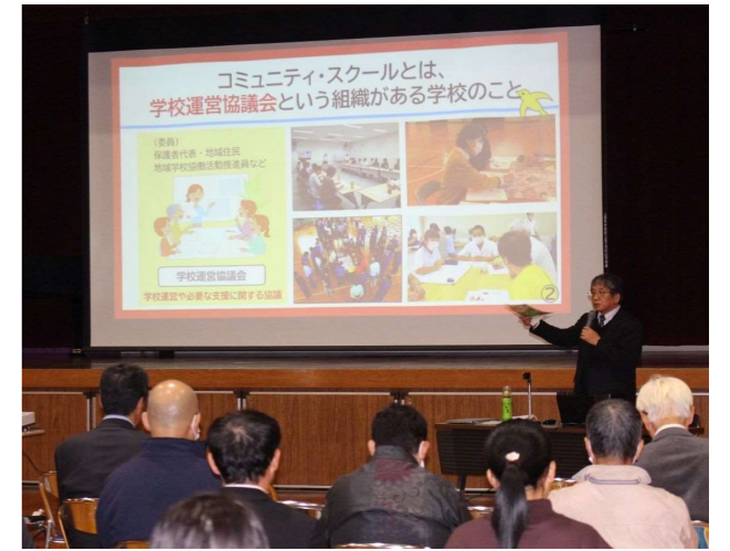
全ての取組の真ん中に子どもたちを