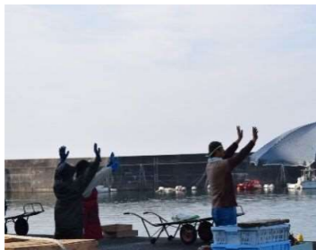
どんなCMになるのでしょうか