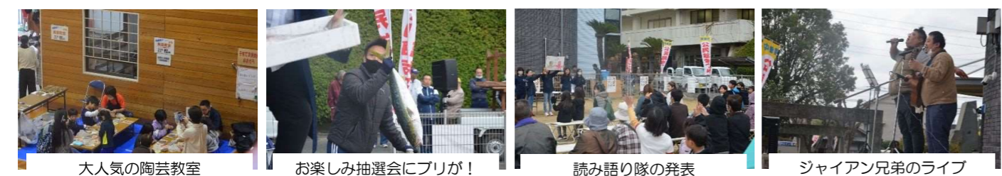
大人気の陶芸教室 お楽しみ抽選会にブリガ！ 読み語り隊の発表 ジャイアン兄弟のライブ

来年も多くの方が交流を深められる場として、上灘公民館まつりが盛大に開催されることを願っております。