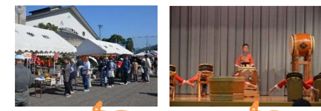
大勢の参加者 下灘太鼓