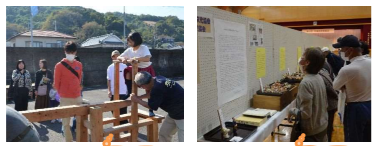
だいがらもちつき たくさんの展示物

11月3日(金)、下灘コミュニティーセンター周辺で、4年ぶりに『第16回下灘公民館まつり』が開催されました。当日は、屋外ブースで各自治公民館や双海地域で活動している団体による出店がありました。参加者は400人を上回りとても賑わいました。また、今回から新たな試みとして行ったリストバンドによるお楽しみ抽選会も大変盛り上がりました。体育館の中では、文化協会主催の芸能発表会も開催されました。