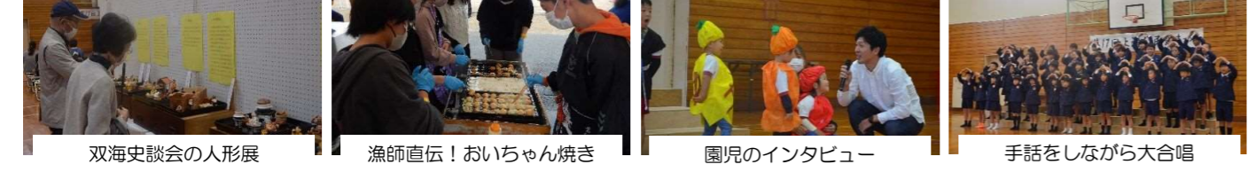
双海史談会の人形展 漁師直伝！おいちゃん焼き 園児のインタビュー 手話をしながら大合唱