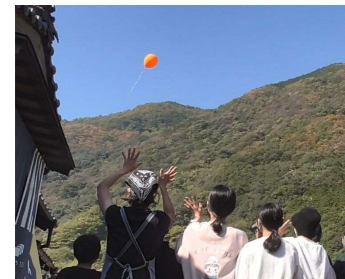
地域の方々が撮影に協力してくれました

11月5日(日)、双海町ジュニアリーダー会が「ふるさとCM大賞」へ出品する映像を撮影しました。今回は、松山聖陵高校ドローン研究部の皆さんに依頼し、ドローンを使って空撮しました。「ふるさと双海を紹介するPR動画を作りたい！」と始まったこの活動ですが、地域の方にもご出演いただいております。快くご協力いただきました皆様、誠にありがとうございました！今後ともよろしくお願いいたします！