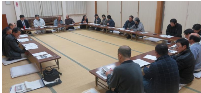
中山地区公民館組織図

中山地区公民館 伊予市中山町出淵 2-138-1 TEL 967-1111 FAX 967-1101 中山町 (3月末現在) 人口 3,139人(-14) 男性 1,484人(-5) 女性 1,655人(-9) 世帯数 1,369戸(-2)