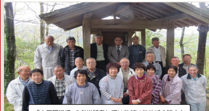
「山四国巡拝」のお世話をいただいた地域の皆さん

公民館行事として約40年余り続く、伝統行事「山四国巡拝」を、地域の文化遺産として継承していただいています。