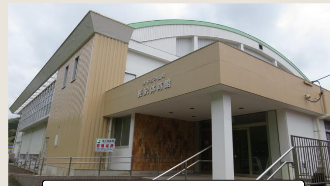
完成した「長沢体育館」と設置された防災倉庫

改修工事などが行われ、完成後は地域住民の避難場所としての役割を果たす施設となります。