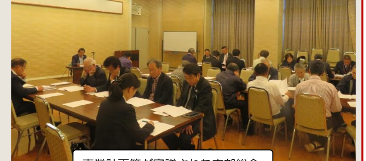
事業計画等が審議された支部総会

総会では前年度の事業報告の確認と今年度の「伊予中山ホテルまつり」や「夏祭り」、「栗まつり」等のイベント開催日程、内容等事業計画が承認されました。