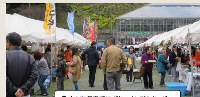
多くの来場者でにぎわった「桜まつり」

当日は桜の開花は少し早かったものの、「出店バザー」や「マッピーとジャンケン」、「もちつき実演販売」など多彩な催しが行われ、訪れた家族連れなどが楽しい一日を過ごされていました。