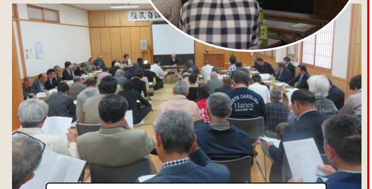
活動報告等が行われた「住民自治されだに」総会