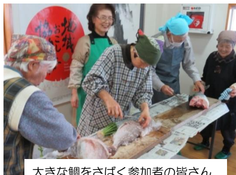
大きな鯛をさばく参加者の皆さん

献立はどれも好評で会食をしながら「美味しかった」「自宅でも作ってみたい」と話されていました。