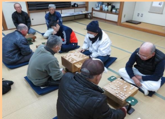
白熱した対局が繰り広げられました