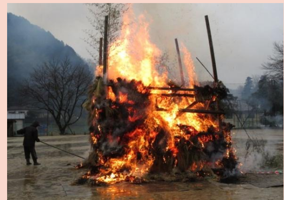
昨年行われた「どんど焼き」