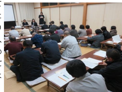
4地区で開催された懇談会

人権意識の高揚と啓発に努めて参ります。今後とも人権同和教育問題解決のため、ご指導・ご支援を頂きますようお願いいたします。