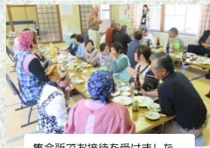
集会所でお接待を受けました