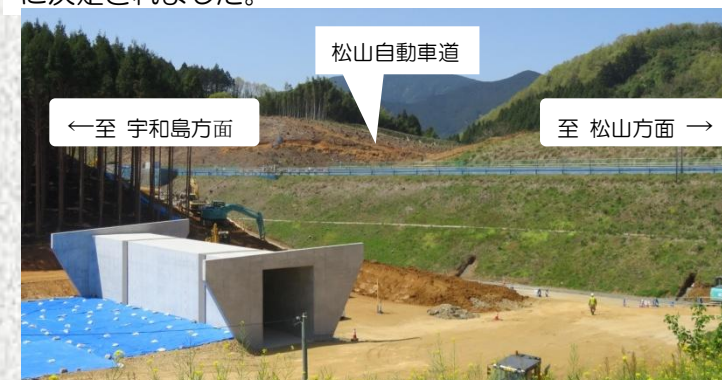
工事が進む「中山スマートIC」接続箇所

ICの名称について、接続箇所は双海地区分に当たりますが、仮称名が新聞記事等に掲載されるなど周知が進んでいること等から、仮称名と同じ「中山スマートIC」に決定されました。