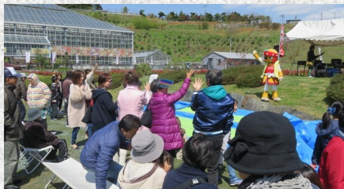
多くの人出があった「花の森桜まつり」

当日は、あいにく桜は葉桜の状態でしたが、多くの出店が並んだ会場では、じゃんけん大会やフラダンス・フリーマーケット・餅まき等のイベントが行われ、大勢の人出で賑わっていました。