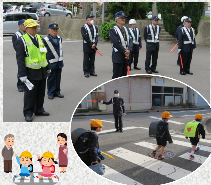
街頭指導に当たる交通指導員の皆さん

9日に入学式を終えたばかりの新小学一年生の児童も上級生と集団登校で元気に登校。交通指導員さんが横断歩道で児童の安全を見守りました。