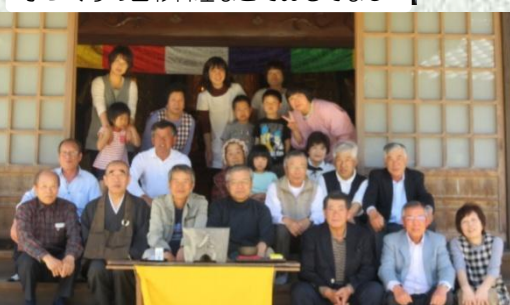
梅原地区「梅原寺」にて地域の皆さん