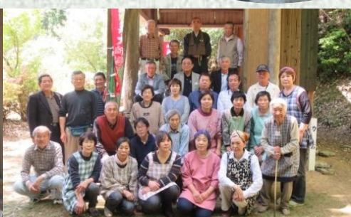
福住地区「谷の堂」にて地域の皆さん