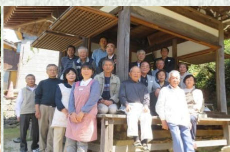
永木地区「森の堂」にて地域の皆さん