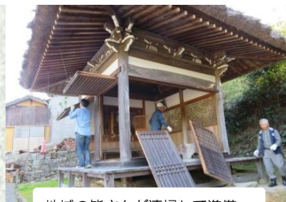
地域の皆さんが清掃して準備

中山地区公民館 伊予市中山町出淵 2-138-1 TEL 967-1111 FAX 967-1101 中山町 (3月末現在) 人口 3,041人(-10) 男性 1,441人(-4) 女性 1,600人(-6) 世帯数 1,357戸(-3)