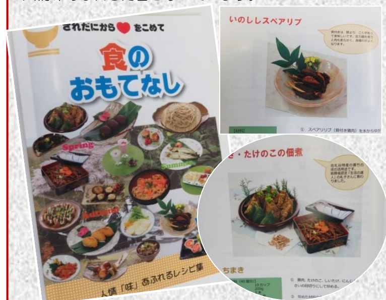
佐礼谷の食材を使ったレシピ集「食のおもてなし」

今回発行されたレシピ集は地域の名人も登場。佐礼谷の歴史も含め、地域の食材や特産品が紹介されており、人情味あふれる内容となっています。