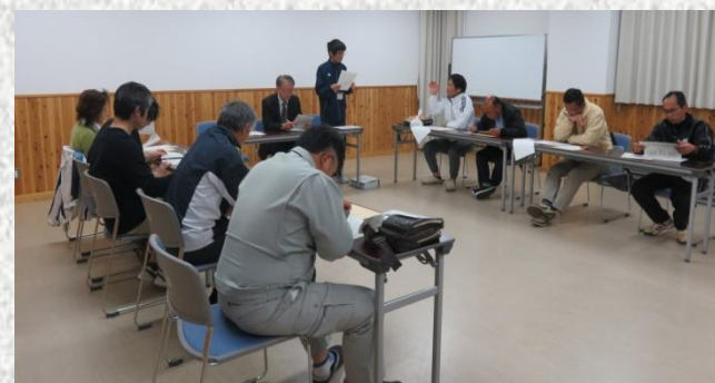
社会体育事業等について協議が行われました

4月17日（火）、中山地区公民館会議室で関係者12名が出席して、「スポーツ推進委員・体育部長会」が開催されました。