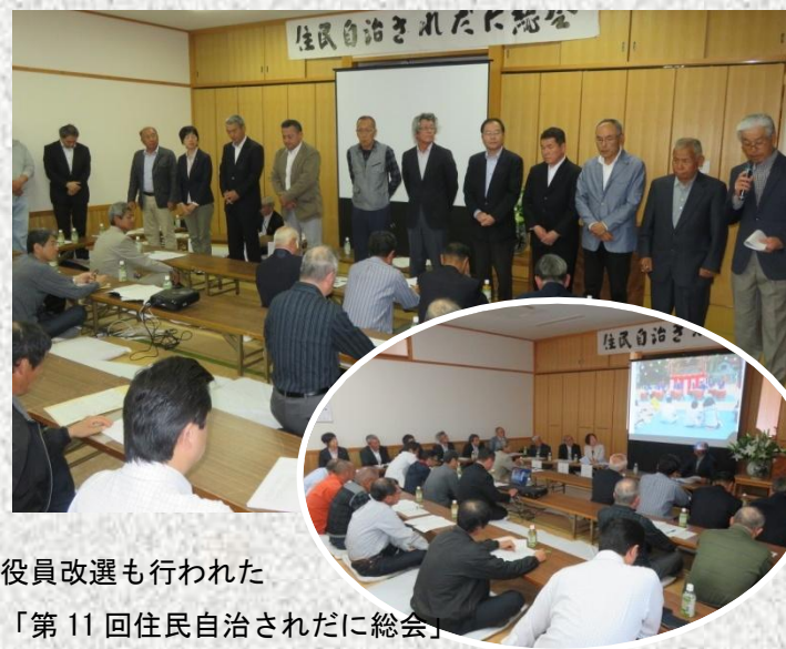
役員改選も行われた 「第11回住民自治されだに総会」

4月22日（日）、佐礼谷生活改善センターで、「第11回 住民自治されだに総会」が開催されました。