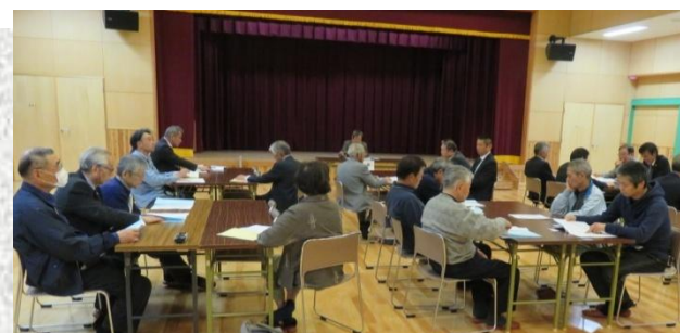
今年度の事業計画案等が審議された総会