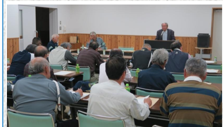
▲今年度の事業計画及び収支予算等が審議された総会

5月14日(月)、中山地域事務所で「平成30年度伊 予交通安全協会中山支部通常総会」が開かれました。