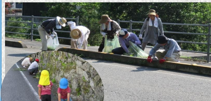
▲国道沿いの草引き作業を行った 豊岡二区の皆さん

6月3日(日)には、豊岡二区分館の皆さんが集会所 周辺の草木の剪定や国道沿いの草引作業に汗を流し夏 場を前にすっかりきれいになりました。