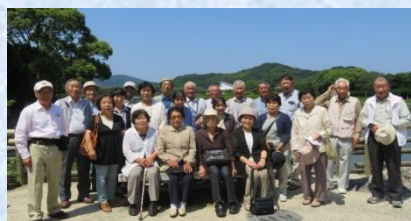
▲永木老人クラブの研修旅行