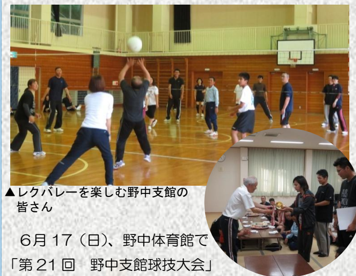
▲レクバレーを楽しむ野中支館の 皆さん

6月17日(日)、野中体育館で 「第 21 回 野中支館球技大会」 が行われ、レクバレー大会で親睦を深め合いました。