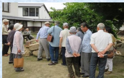
▲佐礼谷老人クラブの研修旅行

毎年、各老人クラブ では視察研修旅行等 を通じて会員同士の親睦 を深められています。 6月には、「永木」・ 「佐礼谷」老人クラブ の皆さんが研修旅行に 出かけられました。