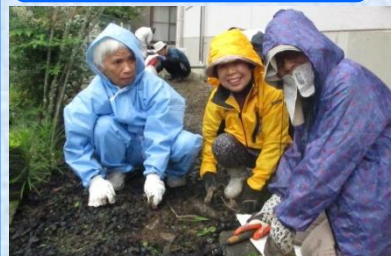
清掃活動を行う「佐礼谷老人クラブ」 の皆さん

老人クラブでは、各単位 で清掃等のボランティア 活動を行っています。 6月23日には、「佐礼谷 老人クラブ」の皆さんが 佐礼谷診療所周辺等の除 草作業を行いました。