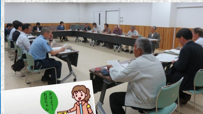
▲今年度の巡回補導計画等 について協議が行われた委員会

当日は、今年度の巡回補導計画について協議が行われ た後、各小・中学校からは児童生徒の様子及び健全育成 を図るための取組み、また、杉本中山駐在所長からは少 年の非行概況等について説明がありました。