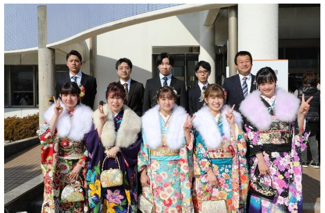
中山中学時代の恩師と