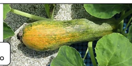
おもしろいかぼちゃだね。