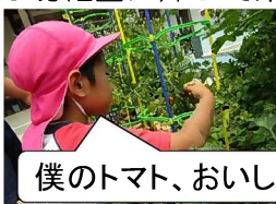
僕のトマト、おいしいよ。

夏の園庭は、野菜たちでいっぱいです。年長児は今年、自分の鉢にもミニトマトを植えました。夏の日差しをいっぱい浴びて、赤く色付くごとに「おいしいね。」と口の中へ。ウェルピア伊予でいただいたかぼちゃの苗も、長ひょろい実がたくさん育ちました。夏休みを終えて、元気な子ども達が幼稚園に帰って来るのを待っています。