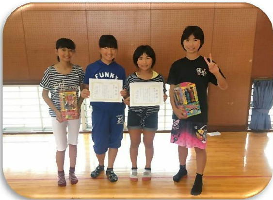
優勝 小学生の部：6年生仲よし4人組チーム

今後も体育会では、軽スポーツをはじめ誰でも簡単にできるイベントを企画しておりますので、たくさんの方々のご参加をお待ちしております。