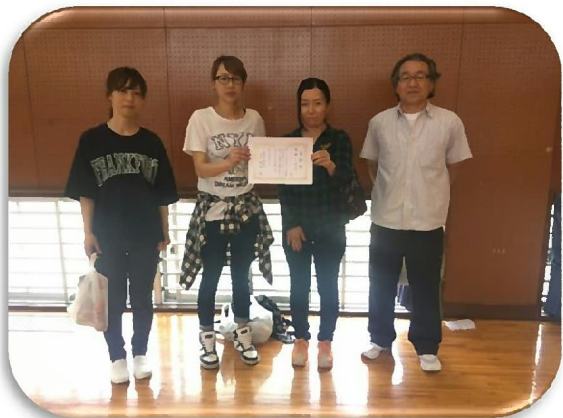
優勝 一般の部：ちょっと今から仕事してくるチーム